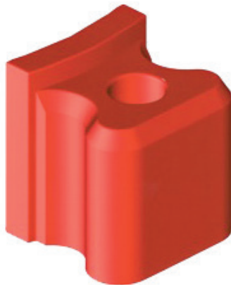
HHK - Herdecker Hybridkrone